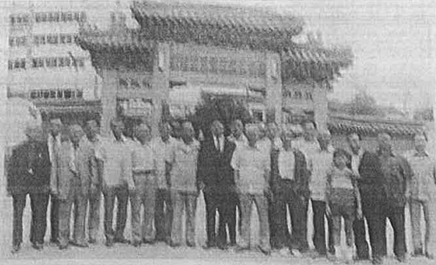
民國六十五年八月廣州聚會於台北市