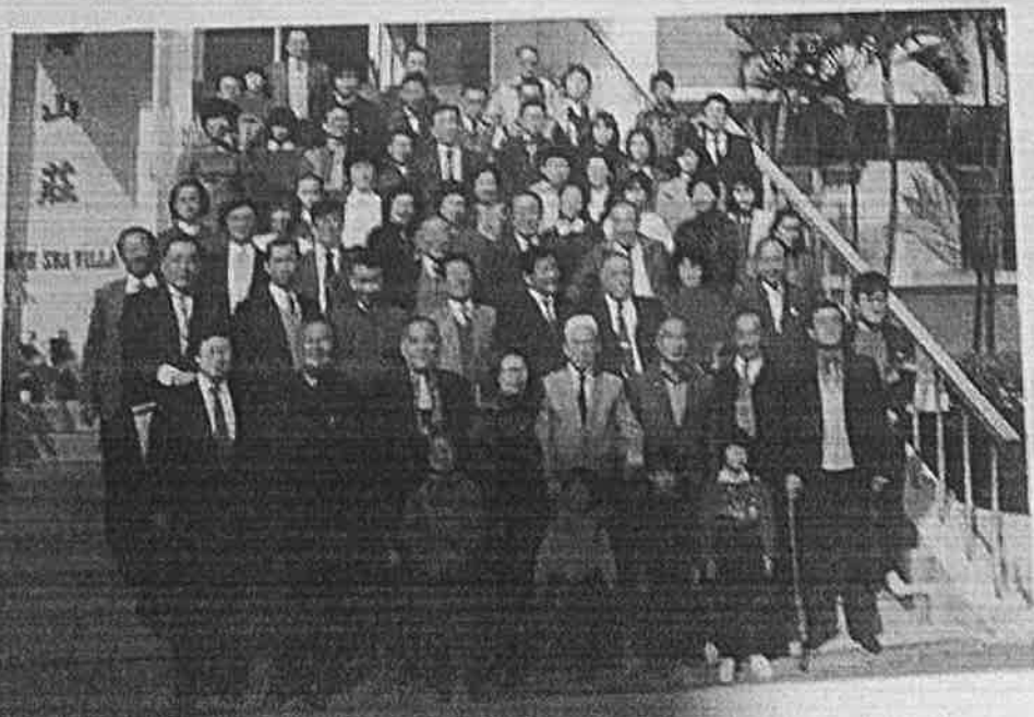
民國七十五年高麗宗親會於台北市碧海山莊，餐後合影